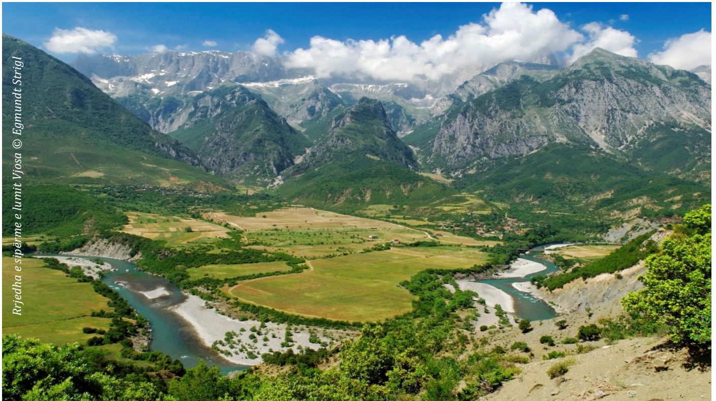
Rrjedha e sipërme e lumit Vjosa

Baseni i Lumit Vjosa ka një rëndësi të veçantë në trashëgiminë natyrore të kontinentit Evropian, përveç kësaj është dhe një mundësi unike për studimet e shkencave lumore. Prandaj ideja e përcaktimit të të gjithë luginës si një “zonë e ndaluar” për ndërtimin e hidrocentraleve është një opsion dhe një kërkesë për vendim-marrësit në Shqipëri. Megjithatë në mënyrë të veçantë në lidhje me projektin e hidrocentralit të Poçemit kërkesat kryesore janë: