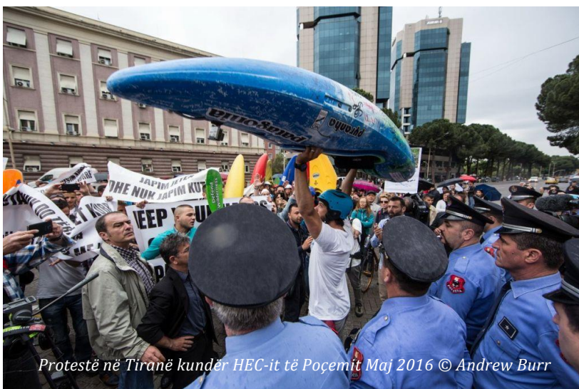
Protestë në Tiranë kundër HEC-it të Poçemit Maj 2016

Gjatë 10 muajve të fundit kanë qenë rreth 70 prezencat në media që kanë trajtuar problematikat e ndërtimit të hidrocentraleve në basenin e lumit Vjosa. Mbulimi mediatik ka qenë mjaft inkurajues duke qenë se lajmet lidhur me këtë çështje janë pasqyruar nga mediat që nga SHBA-ja deri në Japoni duke përfshirë dhe shumicën e mediave më të rëndësishme Evropiane si edhe ato Shqiptare.