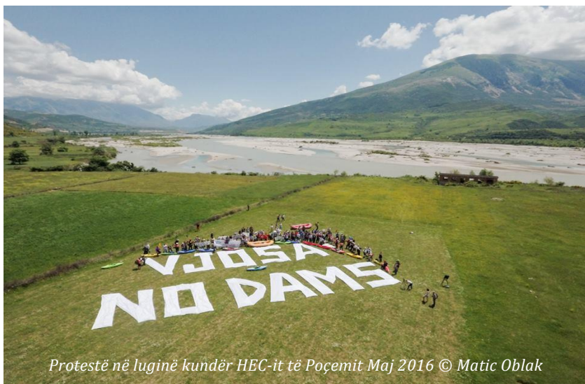
Protestë në luginë kundër HEC-it të Poçemit Maj 2016