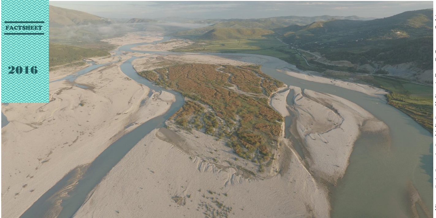
Vjosa në pjesën e gjerë mbi digën e Kalivaçit